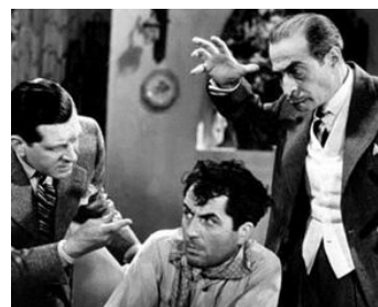
1935 PARIS-CAMARGUE de Jack Forrester avec Julien Carette, Max Dearly