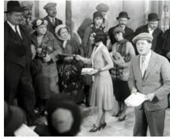
1930 SOUS LES TOITS DE PARIS de René Clair avec Pola Héry