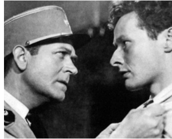
1938 LA PISTE DU SUD de Pierre Billon avec Jean-Louis Barrault