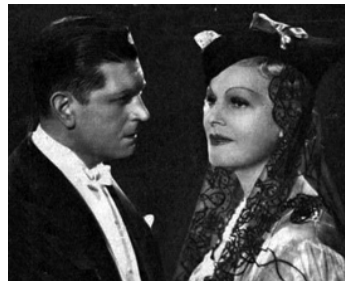
1937 À VENISE, UNE NUIT de Christian-Jaque avec Elvire Popesco