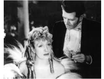
1943 AU BONHEUR DES DAMES d'André Cayatte avec Suzy Prim