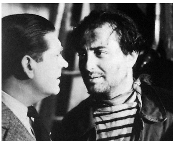
1948 LES FRÈRES BOUQUINQUANT de Louis Daquin avec Roland Lesaffre