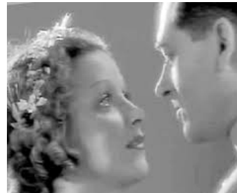
1933 VOLGA EN FLAMMES de Victor Tourjansky avec Danielle Darrieux