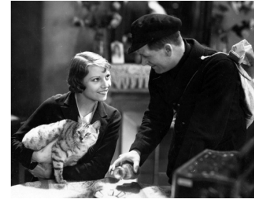
1931 UN SOIR DE RAFLE de Carmine Gallone avec Annabella