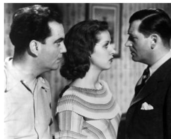
1934 L'OR DANS LA RUE de Curtis Bernhardt avec Raymond Cordy, Danielle Darrieux