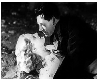
1934 LE PAQUEBOT TENACITY de Julien Duvivier avec Mary Glory