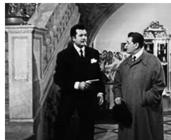
1954 CHÉRI-BIBI de Marcello Pagliero avec Jean Richard