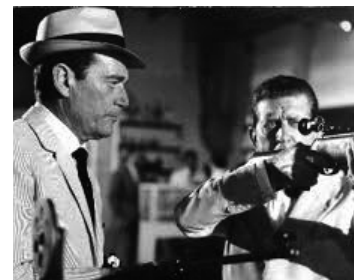
1962 BONNE CHANCE, CHARLIE de Jean-Louis Richard avec Eddie Constantine