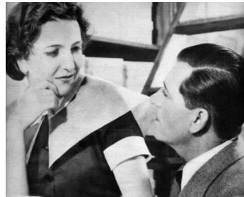
1933 CAPRICE DE PRINCESSE de Karl Hartl et Henri-Georges Clouzot avec Marie Bell