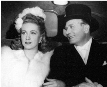
1941 CAPRICES de Léo Joannon avec Danielle Darrieux