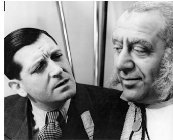
1933 THÉODORE ET COMPAGNIE de Pierre Colombier avec Raimu