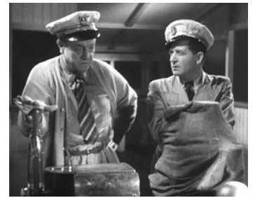
1937 MOLLENARD de Robert Siodmak avec Harry Baur