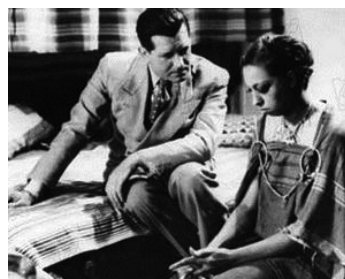
1935 PRINCESSE TAM-TAM d'Edmond T. Gréville avec Joséphine Baker