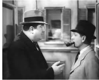
1942 PICPUS de Richard Pottier avec Gabriello