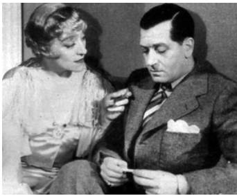
1936 JENNY de Marcel Carné avec Françoise Rosay