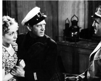
1939 L'OR DU CRISTOBAL de Jacques Becker avec Dita Parlo, Charles Vanel