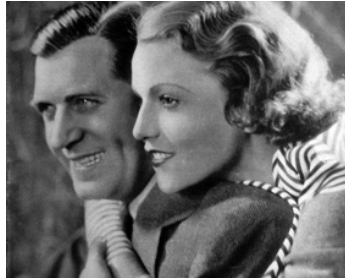
1932 UN FILS D'AMÉRIQUE de Carmine Gallone avec Annabella