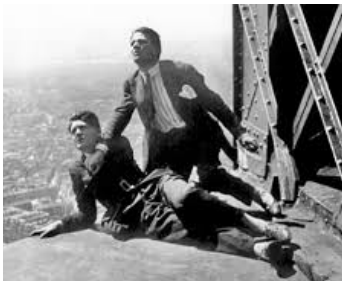
1923 PARIS QUI DORT de René Clair avec Henri Rollan