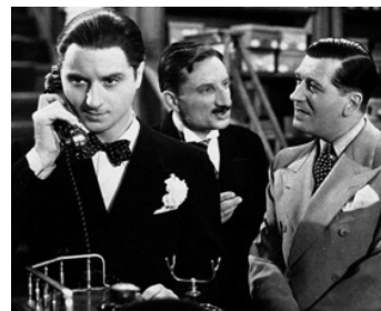
1935 DÉDÉ de René Guissart avec Claude Dauphin, René Bergeron