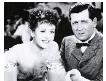
1935 LE CONTRÔLEUR DES WAGONS-LITS de Richard Eichberg avec Danielle Darrieux