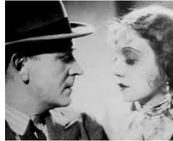
1931 L'OPÉRA DE QUAT'SOUS de Georg- Wilhelm Pabst avec Annabella