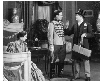
1928 UN CHAPEAU DE PAILLE D'ITALIE de René Clair avec Alice Tissot, Alexis Bondi