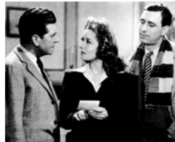
1946 L'ASSASSIN N'EST PAS COUPABLE de René Delacroix avec Jacqueline Gauthier