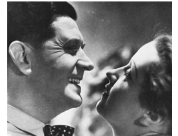
1934 LA CRISE EST FINIE de Robert Siodmak avec Danielle Darrieux