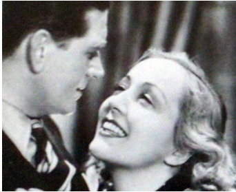
1938 LA RUE SANS JOIE d'André Hugon avec Dita Parlo