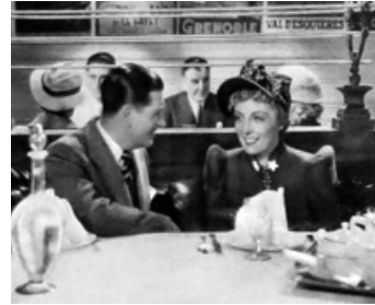
1938 L'INCONNUE DE MONTE-CARLO d'André Berthomieu avec Dita Parlo