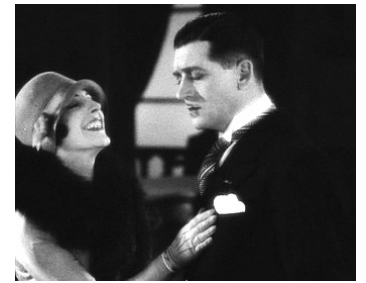
1928 LES NOUVEAUX MESSIEURS de Jacques Feyder avec Gaby Morlay